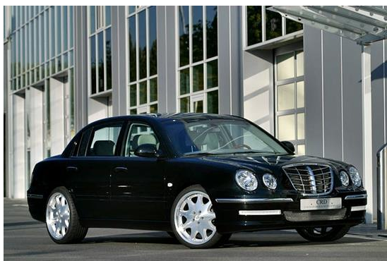
Kia Opirus / Kia Amanti