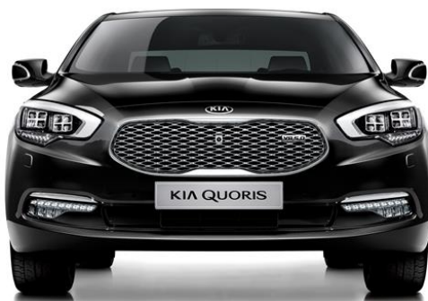
Kia Quoris / K900